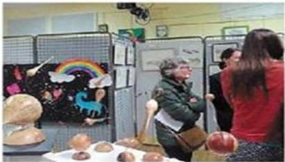
La 14 e exposition se tiendra du 4 au 11 octobre.